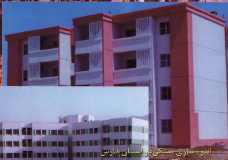
انبوه‌سازی مسکن در استان فارس