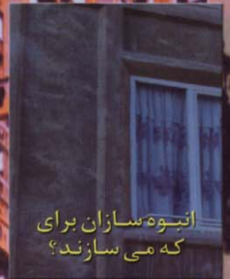
انبوه‌سازان برای که می‌سازند؟