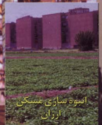
انبوه‌سازی مسکن ارزان