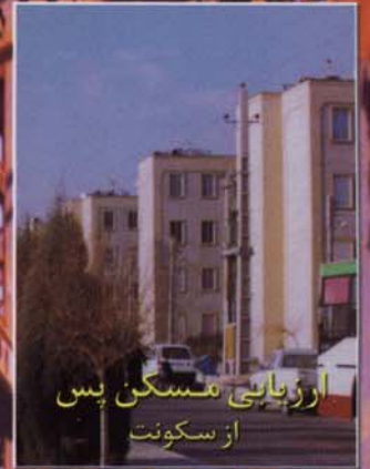
ارزیابی مسکن پس از سکونت

سال دوم - شماره ۵ - پاییز ۱۳۸۰ - بها ۵۰۰ تومان